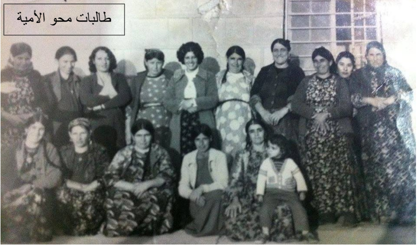
طالبات محو الأمية