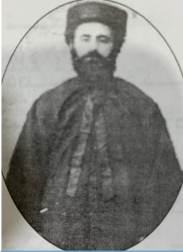
م. شتة جندلجج حوندج