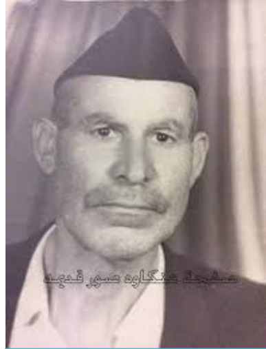
جلكفتج فحجج ججججج ججججج